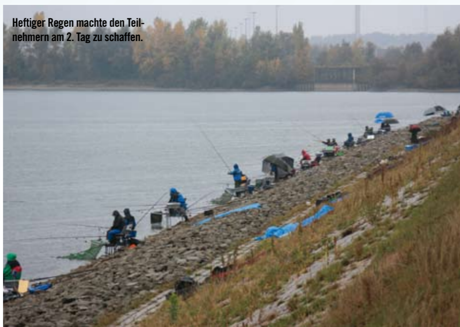
Heftiger Regen machte den Teilnehmern am 2. Tag zu schaffen.