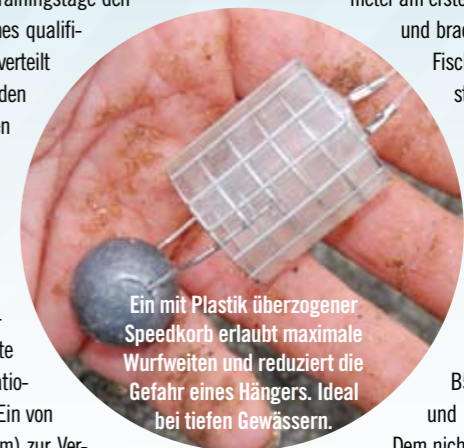
Ein mit Plastik überzogener Speedkorb erlaubt maximale Wurfweiten und reduziert die Gefahr eines Hängers. Ideal bei tiefen Gewässern.

Wurden während der Trainingstage noch sommerliche 25 Grad Außentemperatur gemessen, rutschte das Thermometer am ersten Finaltag auf 13 Grad Celsius und brachte die Frage zu Tage, wie die Fische wohl auf den Temperatursturz reagieren würden.