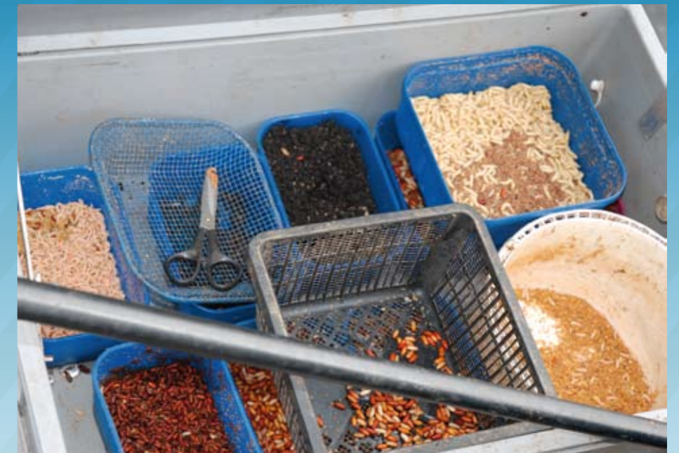
Ein Blick in Michael Zammataros Klappbox. Die Fische im Germersheimer Hafen verlangten nach einer reichhaltigen Ködera Auswahl.

für das Event offen. Der neue Streckenabschnitt im A-Sektor bot eine gut begehare Uferböschung, der alte ins Innere des Hafenbeckens verlaufende Streckenabschnitt im B-Sektor war sehr steil. Damit sich Vorfach und Montage beim Auswerfen nicht verhängen, mussten die Teilnehmer hier den Bereich mit einer Plane abdecken. Zudem machten es die großen Steine im Bereich des Ufers nicht einfach, die Sitzknie ideal und sicher zu positionieren. Die im Abstand von 75 - 100 m befindlichen Treppenplätze bekamen schon während der Trainingstage den Vorzug. Nach der Absage eines qualifizierten Tandems gingen - verteilt auf 2 aufeinander folgenden Sektoren - 27 Teams an den Start. Der sich links zur Rheinmündung befindende A-Sektor wurde wie auch der B-Sektor auf dem Endplatz durch ein Stopper-Team besetzt. Michael Schlögl hatte sich schon früh um Informationen zum Gewässer bemüht. Ein von Willi Dreier (ASV Germersheim) zur Verfügung gestellter topografischer Lageplan war hierbei sehr hilfreich. So konnten beide Sektoren in jeweils gleiche Wassertiefen gelegt werden. Rund 4 m Wassertiefe wies der A-Sektor bis zu einer Distanz von etwa 55 m auf, darüber hinaus wurde es etwa 1 m tiefer. 11 m Wassertiefe gab es im B-Sektor bereits bei 25 m Distanz, so fanden die Teilnehmer in beiden Sektoren gleiche Voraussetzungen. Im Vereinsheim des ASV Germersheim begrüßte Organisator Michael Schlögl die Finalisten und Helfer zum diesjährigen Mosella Tandem Feeder Finale. Zusammen mit