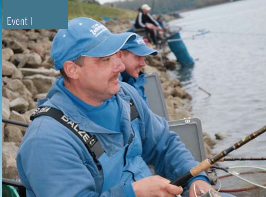
Das spannende Match sorgte auch bei den Rivalen für große Freude.

einfach. blieb der Fisch auf Tiefe, konnte sich leicht der Futterkorb verhängen. Klar im Vorteil war, wer seinen Angelplatz höher ausgerichtet hatte und eine kiesige statt unangenehme Lehmkante vorfand.