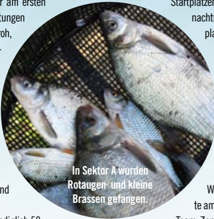
In Sektor A wurden Rotaugen und kleine Brassen gefangen.

Wie von vielen erwartet, dominierte am ersten Finaltag im B-Sektor das Team Zammataro/Kukielka, das sich mit einem Fanggewicht von 8770 g doch etwas deutlicher als erwartet von seinen Verfolgern auf Platz 2, dem